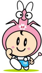
由比のキャラクター 「さくらゆいちゃん」