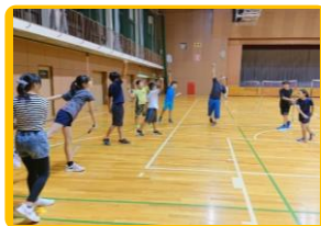
初級バドミントン