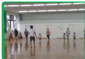
年少・年中・年長親子運動