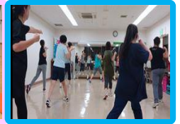
リズムボクシング