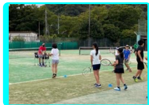
小学生硬式テニス