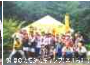
04 夏のカモシカキャンプ（本川根町）