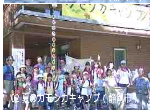
02 夏のカモシカキャンプ（静岡市）