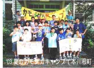
03 夏のカモシカキャンプ（本川根町）