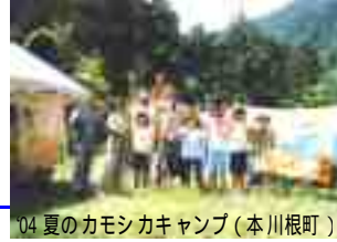
04 夏のカモシカキャンプ（本川根町）