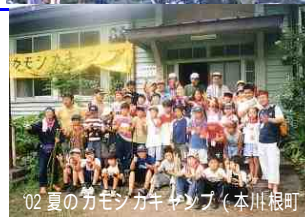
02 夏のカモシカキャンプ（本川根町）