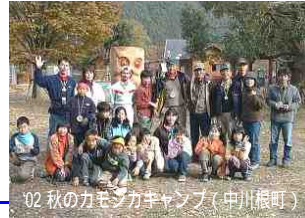
03 秋のカモシカキャンプ（中川根町）