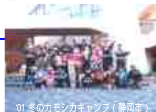
01 冬のカモシカキャンプ（静岡市）