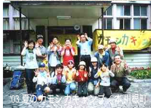
03 夏のカモシカキャンプ（本川根町）