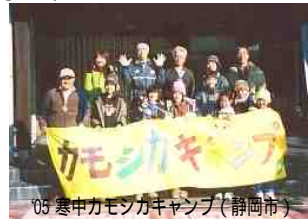
05 寒中カモシカキャンプ（静岡市）