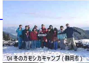
04 冬のカモシカキャンプ（静岡市）