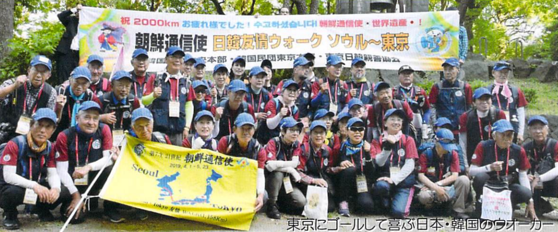
東京にゴールして喜ぶ日本・韓国のウォーカー

日本と韓国内の感染状況によっては予定を変更、または中止する場合がありますのでご了承ください。