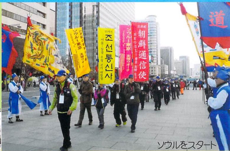
ソウルをスタート

一般公募した日本、韓国、在日韓国人がひとつのチームになって、ソウル～東京の「朝鮮通信使の道」(2000キロ)を歩きます。2007年から2年に一度実施してきましたが、第8回は新型コロナのため中止し、4年ぶりの開催となります。2023年4月1日にソウル・景福宮を出発して5月23日東京・皇居にゴール。隣国同士的首都を結ぶ定期開催ウォークは世界に例がなく、最近では台湾などからの参加もあり国際化が進んでいます。